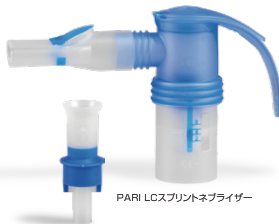
PARI LCスプリントネブライザー