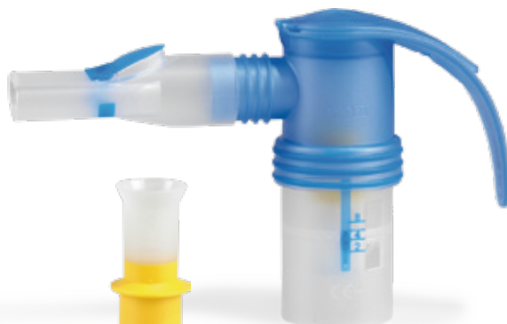
PARI LCスプリントジュニア

5μm以下の粒子の高い比率 エアロゾルのロスを抑 吸入治療をカスタマイズ 洗浄が簡単 可能